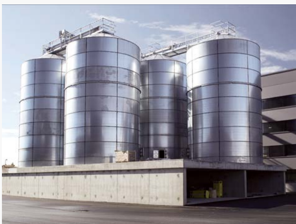
Silo de almacenamiento