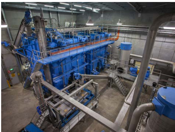
Tolvas de harina